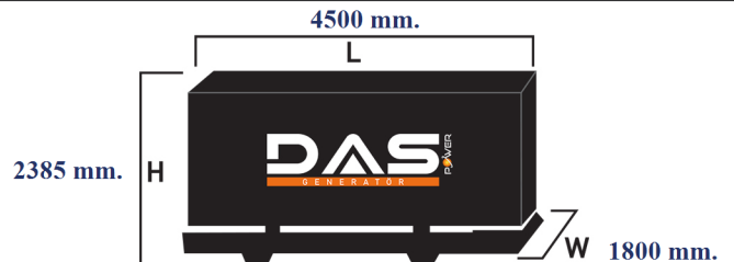
Islak Ağırlık: 5560 kg. Yakıt Tankı Kapasitesi: 495 L