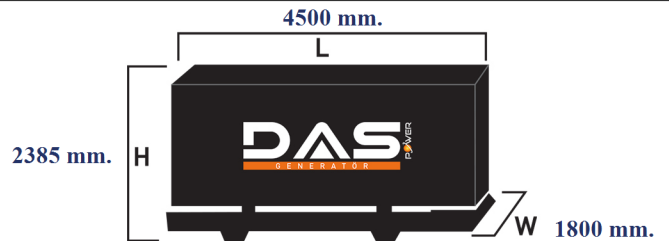
Islak Ağırlık: 5400 kg. Yakıt Tankı Kapasitesi: 495 L