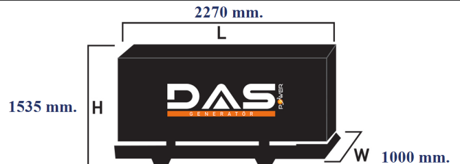
Islak Ağırlık: 1300 kg. Yakıt Tankı Kapasitesi: 138 L