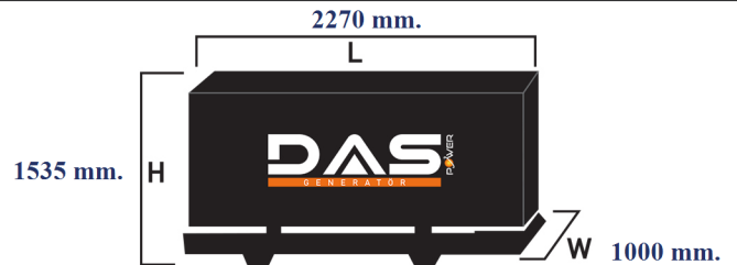
Islak Ağırlık: 1300 kg. Yakıt Tankı Kapasitesi: 138 L