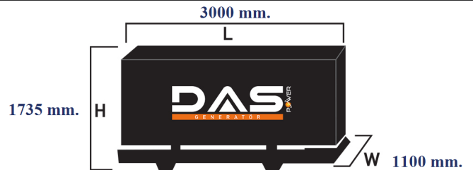
Islak Ağırlık: 2230 kg. Yakıt Tankı Kapasitesi: 173 L