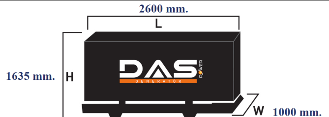
Islak Ağırlık: 1000 kg. Yakıt Tankı Kapasitesi: 138 L