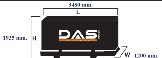
Islak Ağırlık: 3165 kg. Yakıt Tankı Kapasitesi: 245 L