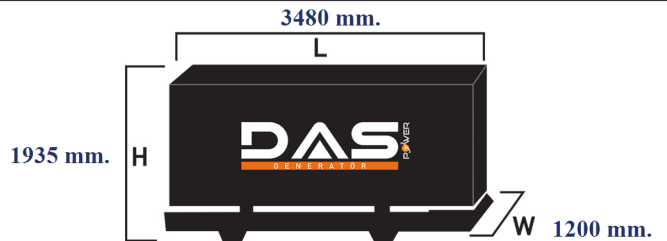
Islak Ağırlık: 2900 kg. Yakıt Tankı Kapasitesi: 245 L