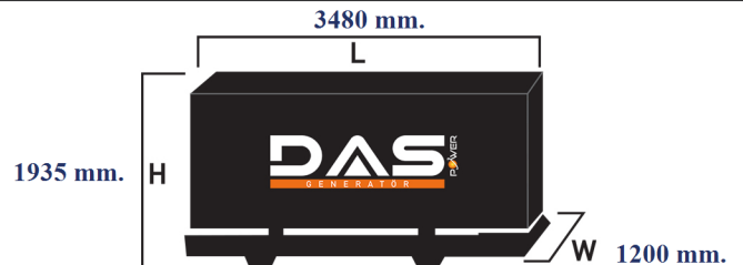
Islak Ağırlık: 2260 kg. Yakıt Tankı Kapasitesi: 245 L