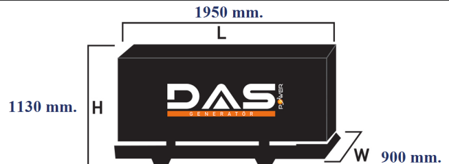
Islak Ağırlık: 520 kg. Yakıt Tankı Kapasitesi: 65 L