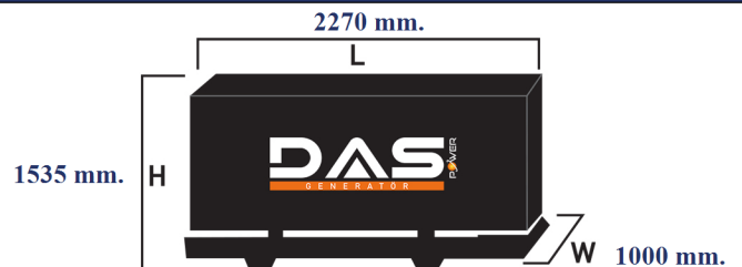
Islak Ağırlık: 1200 kg. Yakıt Tankı Kapasitesi: 138 L