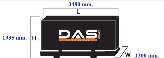
Islak Ağırlık: 2920 kg. Yakıt Tankı Kapasitesi: 245 L