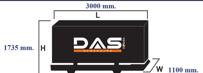
Islak Ağırlık: 1870 kg. Yakıt Tankı Kapasitesi: 173 L