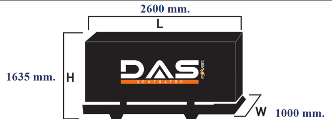
Islak Ağırlık: 1200 kg. Yakıt Tankı Kapasitesi: 138 L